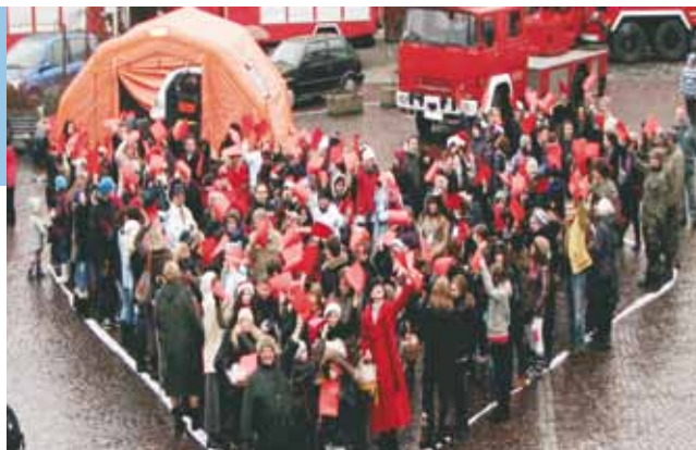
Podczas happeningu na rynku utworzono „Pulsujące serce Skoczowa”.

Przy fontannie odbyła się również sprzedaż gadżetów przekazanych przez dealera BMW z Krakowa.