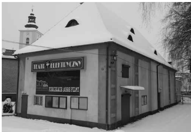
Tak prezentuje się kino dziś...

Swoje podwoje kino otworzyło ponownie po wyzwoleniu Skoczowa, w maju 1945 r. Od tego