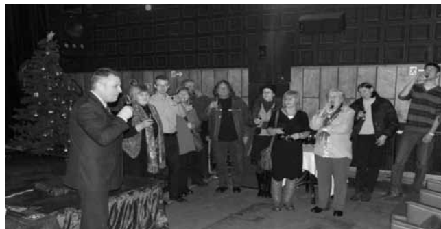
Był toast pożegnalny i za pomyślną przyszłości kina.

to z rozszerzeniem działalności placówki. Kino zostało wzbogacone o scenę. Dzięki temu mogły się tam odbywać różne imprezy kulturalne: przedstawienia teatralne, koncerty muzyczne.