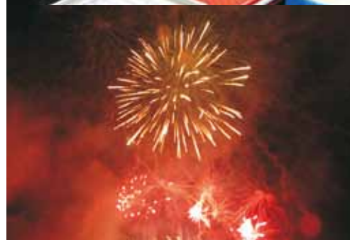
Zdjęcia: Ryszard Stelmaszczyk I. Krassek-Kopyciok