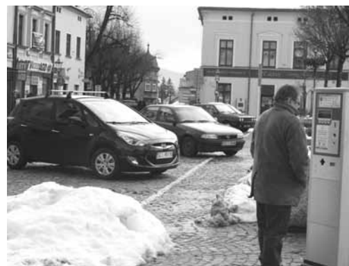
Nie trzeba już szukać drobnych w portfelu, żeby zapłacić za parkowanie.

Opłaty za parkowanie pobierane są zgodnie z zasadami określonymi w uchwale Rady Miejskiej Skoczowa i w zarządzeniu Burmistrza Skoczowa.