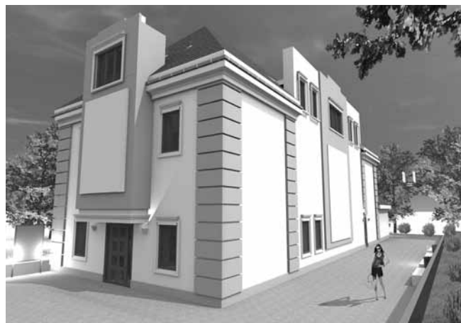
... a tak będzie wyglądało po przebudowie.