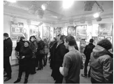
Goście wernisażu z zainteresowaniem oglądali prace uczestników warsztatów fotograficznych.

Wystawę fotografii „Dwa w jednym” można oglądać w ARTdresie, Skoczów, Rynek 18, do 17 lutego 2012 r.