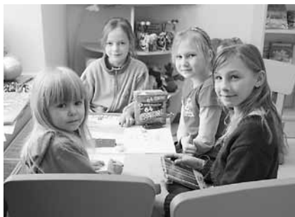
Dzieci w Kąciku Malucha.

Nicholas Sparks „Ostatnia piosenka”: Kolejna piękna historia mistrza romantycznej powieści, która została zekranizowana. Bohaterką książki jest siedemnastoletnia Ronnie, która po rozstaniu rodziców przechodzi trudny okres w życiu. Niespodziewanie dla samej