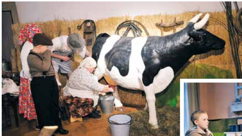
Dojenie prawdziwe lecz krowa sztuczna.

O kolejnym spotkaniu z tradycją w Ochabach piszemy na stronie 11.