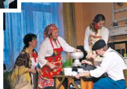
Tu ma być śmietana, a tam mleko.