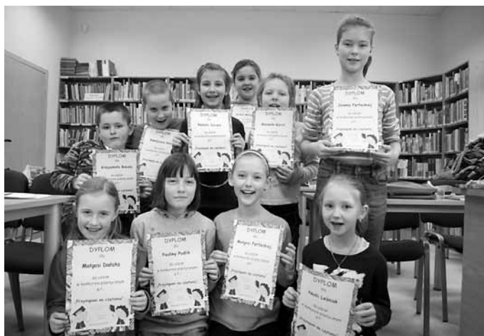
Przylapani na czytaniu – konkurs plastyczny podczas ferii.

Serdecznie zapraszamy wszystkich czytelników do nowej siedziby biblioteki, która mieści się w budynku Centrum Miejskiego Integrator, w Skoczowie przy ul. Mickiewicza 9 (dawny ośrodek zdrowia).