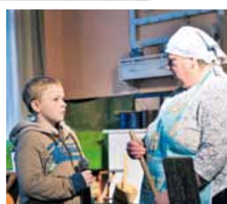
Starko, skónd sie biere mlyko?