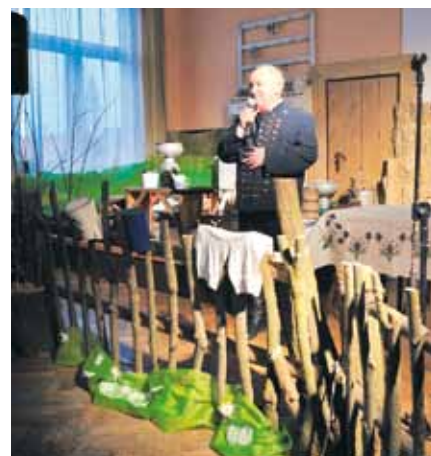
Mlyczne historyje – otwarcie spotkania.