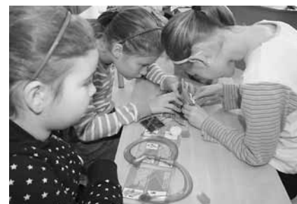
Ferie w bibliotece.

• Podczas ferii dzieci uczestniczyły w konkursie plastycznym, pt.: „Przylapani na czytaniu”, przeprowadzonym wspólnie z Biblioteką Miejską w Cieszynie. A.H.